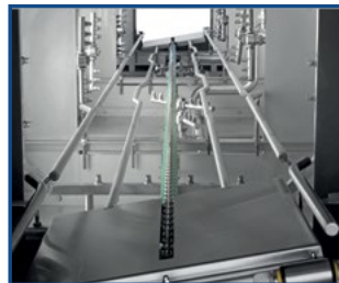
Schräge / versetzte Behälterführung - keine Spritzschatten