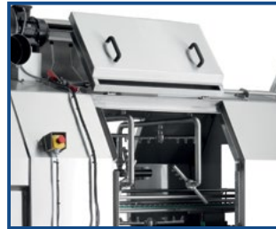
2-Phasen Türöffnung - maximale Zugänglichkeit