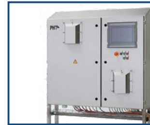
Schaltschrank aus Edelstahl - hygienisch mit Schrägdach und Display