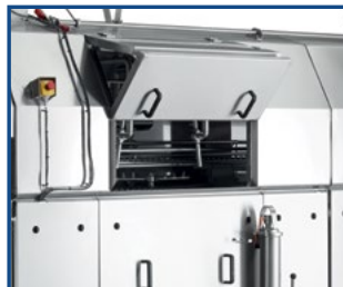
2-Phasen Türöffnung - Reinigungsstellung