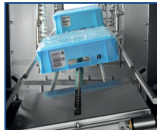
Keine Niederhalter - einfache Bedienung