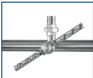
Rotierende Düsen - effiziente Reinigung