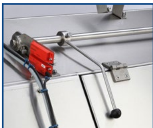
Abschaltvorrichtung - maximale Sicherheit für den Benutzer