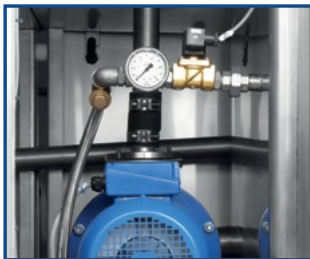
Manometer zur Druckprüfung – einfache Funktionskontrolle