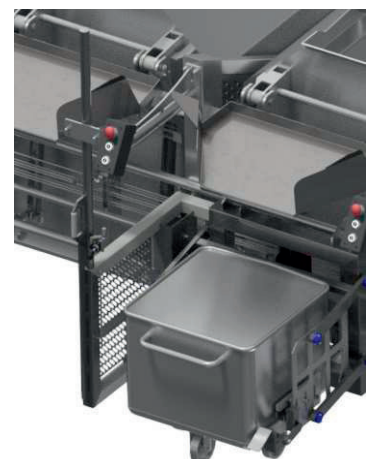
Pneumatischer Wiegewagen – optionale Einbindung kundenseitig gewünscht Terminal möglich