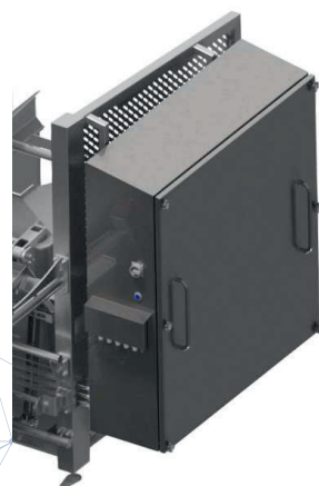
Schaltschrank seitlich, wahlweise rechts oder links an der Maschine