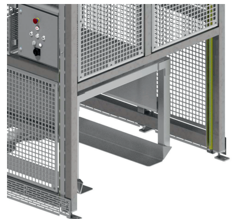
Optional: Einfahrbereich mit Sicherheitslichtgitter überwacht

Abbildungen können abweichen! Technische Änderungen und Irrtümer vorbehalten.