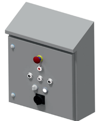
Optional: Schaltschrank im Hygienesdesign