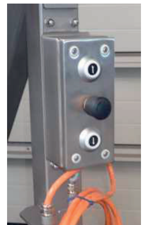
Bedienteil optional in Edelstahl auch in HD-Ausführung möglich

Abbildungen können abweichen! Technische Änderungen und Irrtümer vorbehalten.