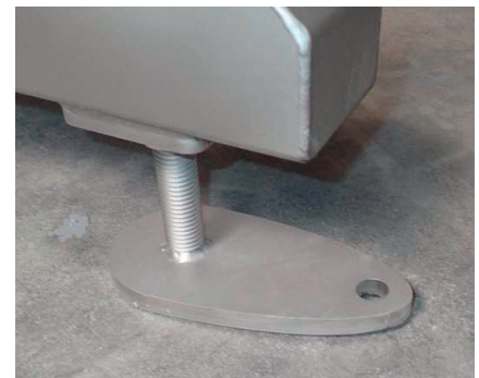
Standardausführung mit höhenverstellbaren Standfüßen