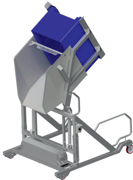
Swingloader SL- 1000