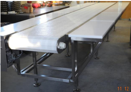
Zerlegeband mit Kunststoffgliederkette und parallel angeordneten Arbeitstischen