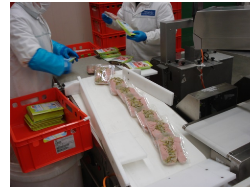
Verpackungsarbeitsplatz: Die tiefgezogene und preisausgezeichnete Ware wird gebündelt und in Kartonagen verpackt.