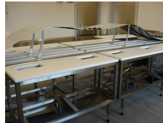
Zerlegeband mit Edelstahlband. Eine robuste und leicht zu reinigende Variante für den industriellen Einsatz