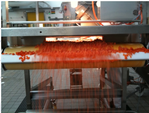
Sortierband für Gemüse zum Aussortieren von Verunreinigungen durch Mitarbeiter seitlich am Band stehend bzw. durch einen starken Magneten.