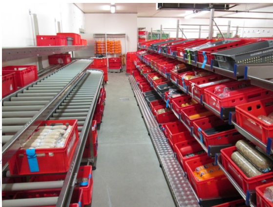
Kommissionierlager mit Abtransport der kommissionierten Ware in den Versandbereich