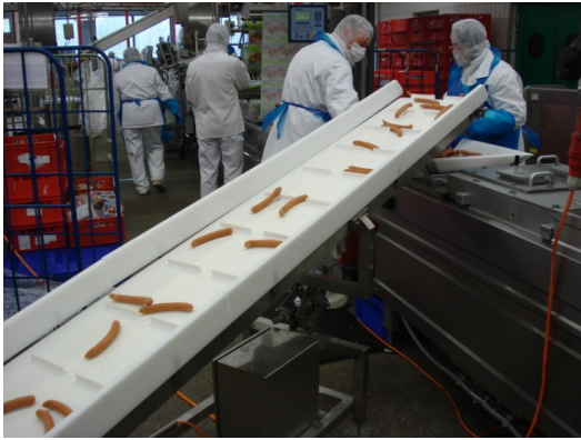
Zuführung der Produkte aus dem Entclipper zum Einlegen in den Tiefziehautomat.