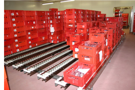
Rollenteppich zur Lagerung von Behälterstapel als Reifelager oder zum Kommissionieren von großen Mengen