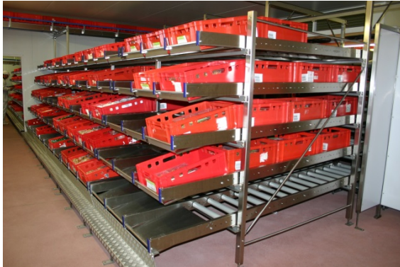
Durchlaufregal zur manuellen Lagerung von Euronorm- Stapelkästen nach dem First-in First-out Prinzip (FIFO)