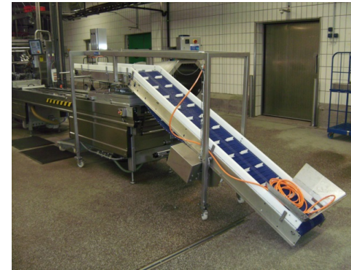
Zuführung der Produkte in den Einlegebereich der Tiefziehmaschine als fahrbare Ausführung.