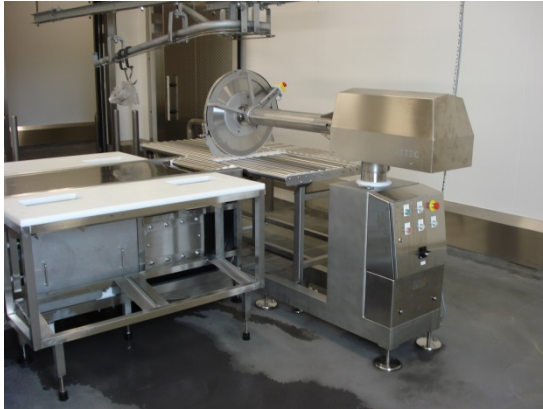
Halbautomatische Grobzerlegung mit einem Kreismesser für ein sauberes, verlustfreies schneiden der Teilstücke