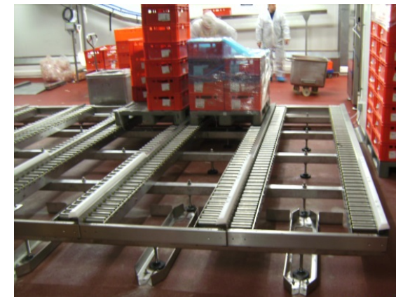
Rollenteppich zur Lagerung von ganzen Paletten als Reifelager, Pufferlager oder zum Kommissionieren von großen Mengen